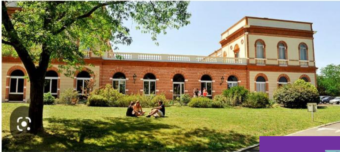
École d'Ingénieurs PURPAN (Sciences...